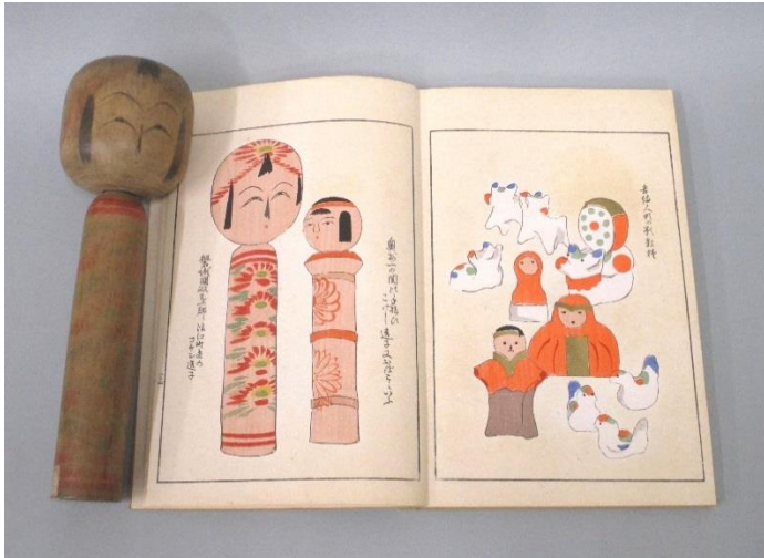
『うなみの友』貳編(明治35年 芸艸堂)と掲載こけし

今回の企画展では、時代別にこけし・資料を展示しながらこけしの歴史をご紹介します。変わっていった作風やこけしへの美意識、変わらない伝統に基づく本質的な魅力などを感じていただければと思います。