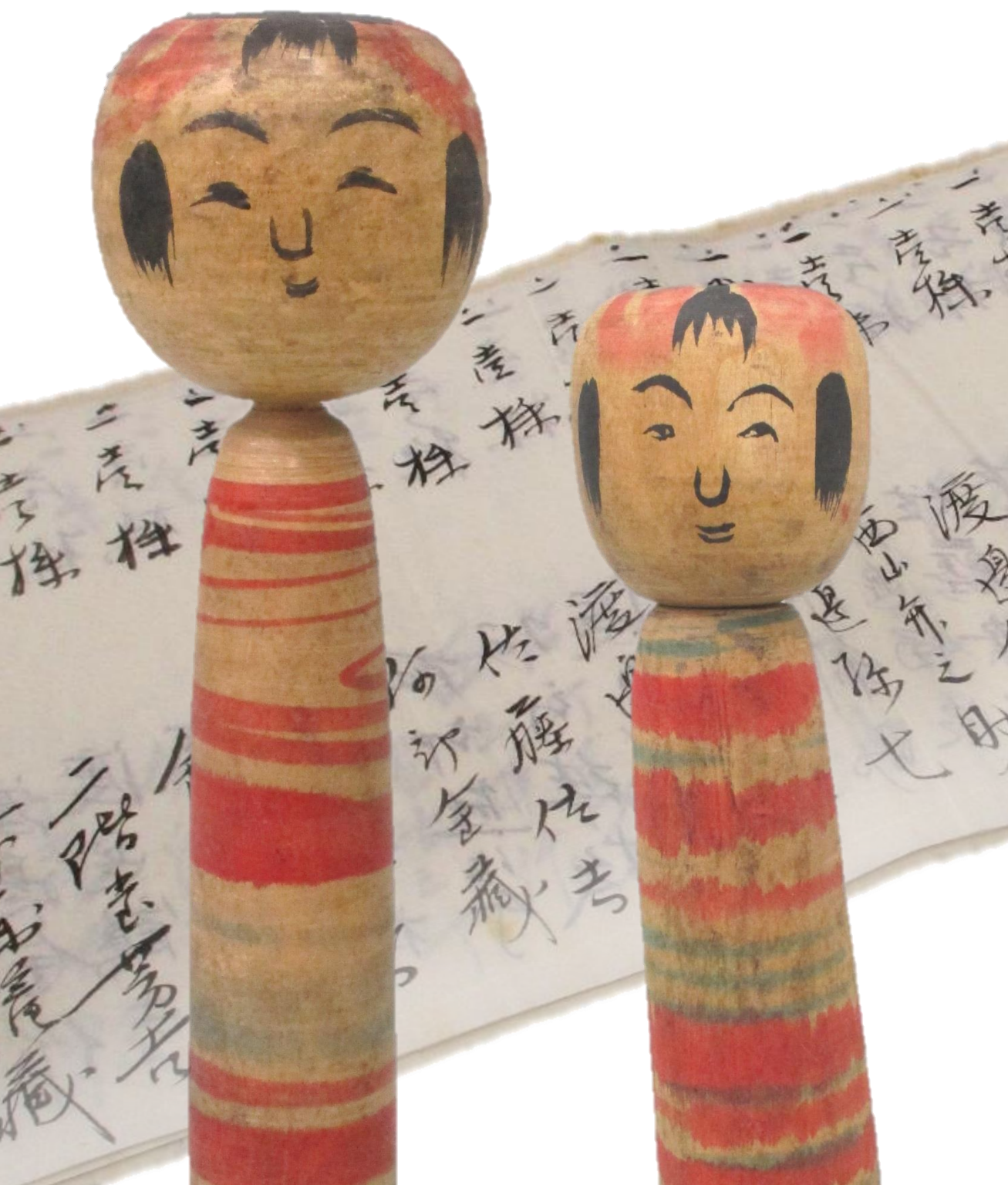
伝 佐久間浅之助こけし、西山辨之助こけし、山根会津屋文書