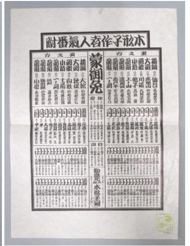
木形子作者人気番付 (昭和10年 木形子洞)